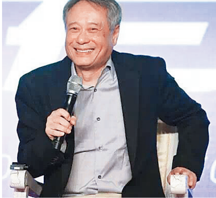
李安在上海国际电影节论坛上发言

本报讯 本届上海国际电影节开幕当天，郭敬明就自己执导的新片《爵迹》接受媒体采访时透露，《爵迹》和《魔兽》是同一个特效团队做的。 郭敬明说，《小时代》拍完后，当时就想玩个不一样的。那时有两个选择，一个是非常科幻的、未来题材的，一个就是《爵迹》。比较了一下，就决定先拍《爵迹》，因为我的性格就是，挑战越大，自己越嗨，那就来做一个比较大的挑战好了。 郭敬明透露，《爵迹》去年六七