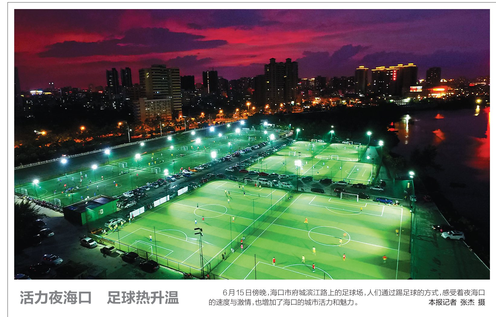
活力夜海口 足球热升温

本报讯（记者刘操 通讯员王剑）近日，海南省减灾委员会发出《关于进一步做好今年主汛期防灾抗灾救灾工作的通知》，要求各成员单位，各市、县、自治县减灾委员会进一步做好今年主汛期防灾抗灾救灾工作。 《通知》提出，当前，我省已进入主汛期，台风、强降雨等自然灾害将会更加频繁，极端灾害性天气发生概率增加，防汛救灾工作形势十分严峻。 《通知》强调，要将传统手段和现代手段相结合，多途径、多平台滚动发布预警信息，切实做到发送到户、预警到人。重点针对汛期可能多发的暴雨洪涝、山体滑坡、泥石流等灾害再次组织开展隐患排查，重点加强大中型水库下游低洼易涝地区的安全隐患排查和巡查。