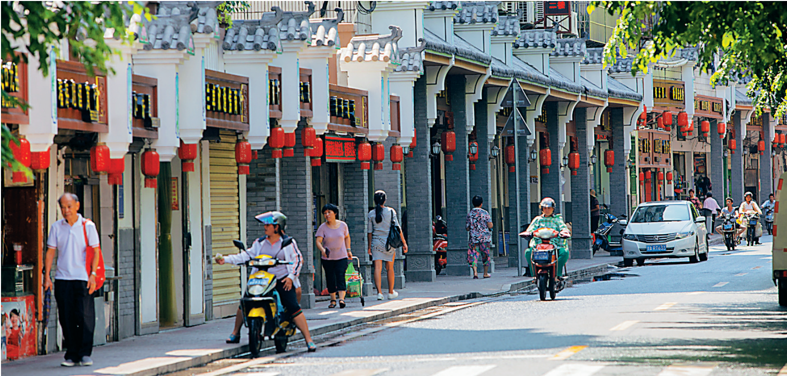
海口龙舌坡老街换新姿

本报海口6月15日讯 (记者计思佳)今天下午,海口市召开“双创”工作5月份考评情况反馈会。根据考评结果,海口4个区中,琼山区排名第1,龙华区排名垫底。 会上,本次考评中排名靠前的琼山区、美兰区蓝天街道办、琼山区国兴街道办等8家单位受到通报表扬,并获得相应奖励。在不同项目考评中排名倒数第1的龙华区、秀英区长流镇、美兰区大致坡镇等8家单位主要负责人依次进行了检讨。 海口市旅发委相关负责人在检讨中表示,针对考评中出现的问题,该部门制定了7项整改措施。其中包括:约谈4个区旅游部门和3个行业协会,进一步明确市、区、协会三级的工作任务和职责;对海口全市旅游企业进行双创专项培训,内容包括旅游服务技能、文明旅游知识、病媒生物防治技术、行业安全管理规范等,培训总量将超过1万人次。