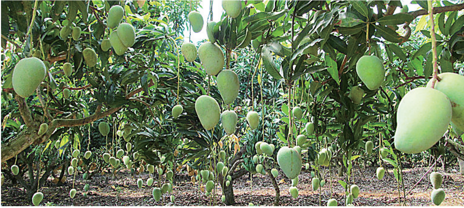
昌江芒果飘香。