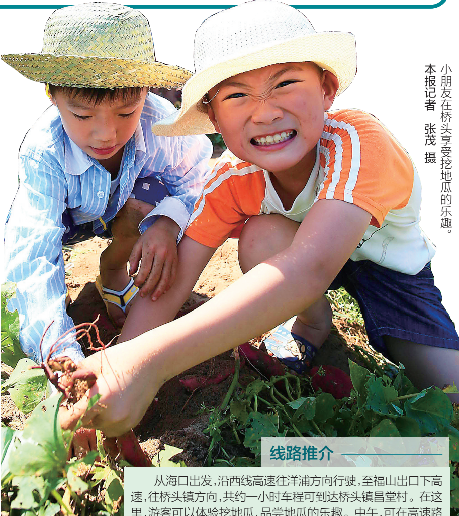
小朋友在桥头享受挖地瓜的乐趣。