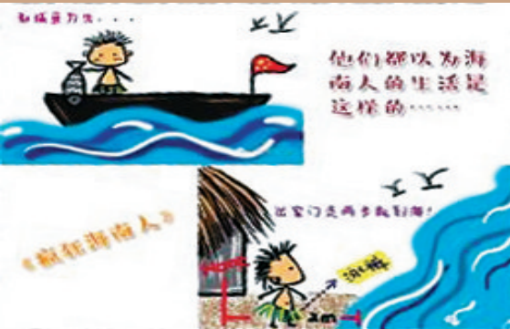
何彦的手绘漫画《岛听说说》。