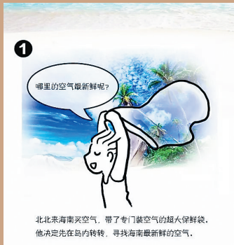
符方超漫画作品《北北海南游玩记》。