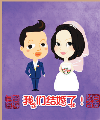
海南仔的“结婚漫画”。