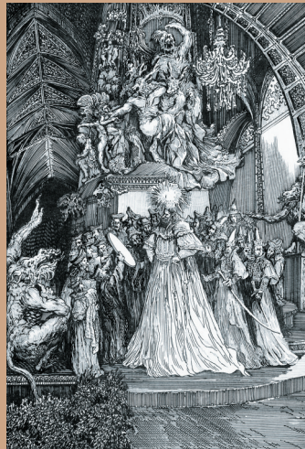
吴楚宴的钢笔插画《皇帝的新装》。