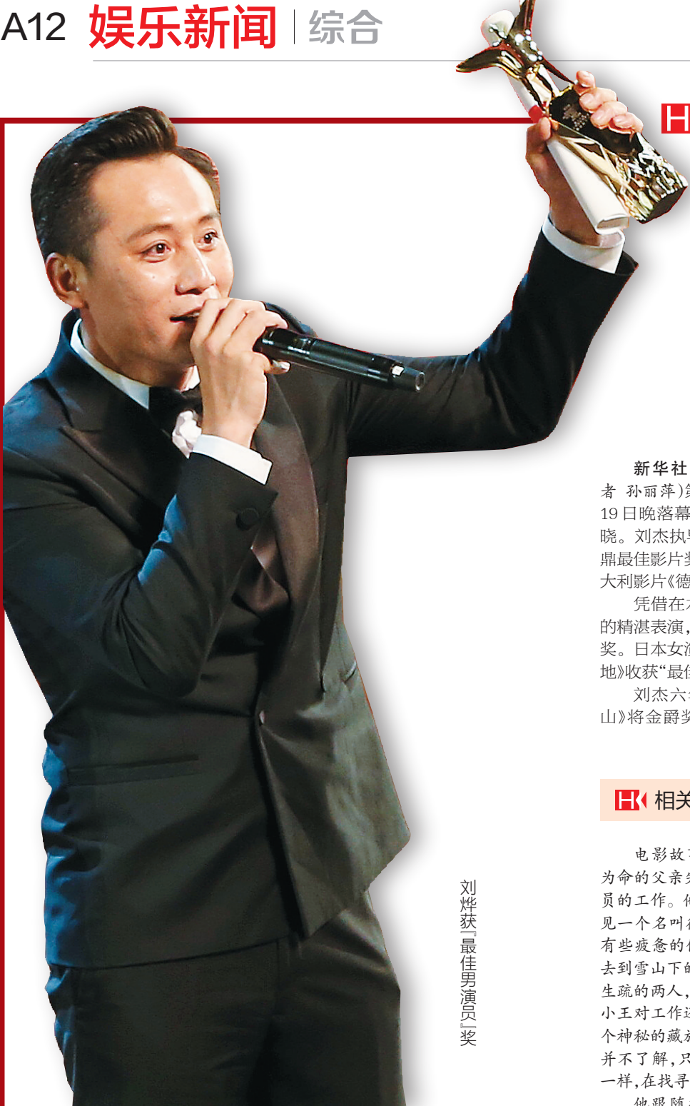
刘烨获「最佳男演员」奖

最佳影片：《德兰》(导演：刘杰 中国) 评委会大奖：《德州见》(导演：维托·帕尔米耶 意大利) 最佳导演：安提·乔金恩《恶之花》芬兰) 最佳女演员：藤山直美《团地》日本) 最佳男演员：刘烨《追凶者也》导演：曹保平 中国) 最佳编剧：安德瑞拉斯·格鲁伯《汉娜睡狗》德国/奥地利) 最佳摄影：郭达明《皮绳上的魂》导演：张杨 中国) 艺术贡献奖：《雾》(导演：罗斯顿·乔夫 菲律宾) 最佳纪录片：《当两个世界碰撞时》 (导演：海蒂·勃兰登堡/马修·奥泽尔 秘鲁) 最佳动画片：《小怪物茉莉》(导演：泰德·西格尔 德国/瑞典/瑞士)