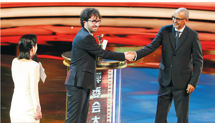
意大利导演维托·帕尔米耶(中)获「评委会大奖」。