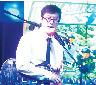
老占分享自己的音乐领悟

本报海口6月19日讯 (记者卫小林)由海南省吉他学会主办的第一场摇滚精品演出活动,昨晚在海口新阿伦故事音乐吧上演,香港摇滚乐队COOPER乐队以完美的英式摇滚演出,赢得乐迷喝彩。 演出之前,COOPER乐队灵魂人物、香港著名音乐人、原Beyond乐队主唱黄家驹助手、现黄贯中乐队成员老占(麦文威)举办了一场“老占的乐与怒”音乐分享会,畅谈了他20多年音乐生涯的领悟。 演唱会上,COOPER乐队献唱了10多首中外经典名曲,包括《光辉岁月》、《至少还有你》、《情人》、《早班火车》、《Let it be》、《Come together》等。其中,COOPER乐队上个月刚刚完成的原创歌曲《蜚言蜚语》则是首次登台演唱,海南的歌迷非常有耳福,听到了他们的首唱,而且是专门针对内地歌迷创作的用普通话演唱的歌曲。 COOPER乐队于去年底组建,成