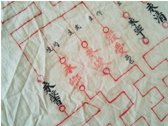
考取功名者的名字用红色墨水书写。

或装在麻袋里，或存放于铁箱中，取出来需要三四个人协助才能以最快的速度打开，而全部摊开能铺满村委会办公室大厅，占地在40—50平方米之间，很是壮观！