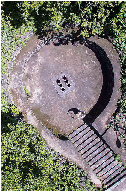
海口市长流镇美楠村的六眼井。