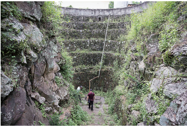
海口市永兴镇儒本村的水井。

典型的海南古井应该具备的一切要素，博井样样不缺，井圈呈圆形，是用一整块火山石雕凿出的；井底泥沙松软，为防止塌陷，几根井梁支撑在井的下部；井庭则呈八卦形，下沉式的井区围栏虽然不高，但也在墙壁上凿出了一座小小的井瓮，仍有香火的遗迹。对于世代村民来说，古井曾是他们生命之水的来源，因此在各村的古井都受到神明一样的香火祭拜；对着古井的则是一道影壁墙，将古井和一座古村门隔开；井的两端各有三级台阶，距古井几米处，还有一个石盆，供平常村民洗衣洗菜之用，这也是海南古井的标配。