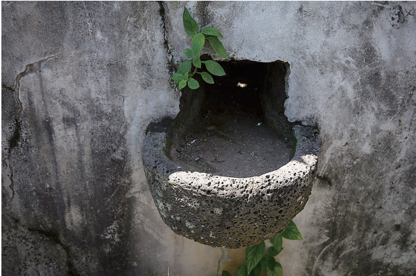
海口市长流镇博抚村方井旁边的耳盆。

丁英俊说，海南古井的选址颇为讲究，大多数古井都建在村庙的左边，从风水上来讲，左青龙右白虎，龙是水生，所以才有龙泉和神龙井的称谓。博井就建在原来王氏祠堂的左边50米处。同样也是由于风水上“龙宅相冲”，所以要用一道影壁将古井和古村门隔开，而影壁上的“王明受福”四个字就出自《易经》的第48卦“井卦”，而井庭本身也呈八卦形，所以说博井的建造颇为讲究。