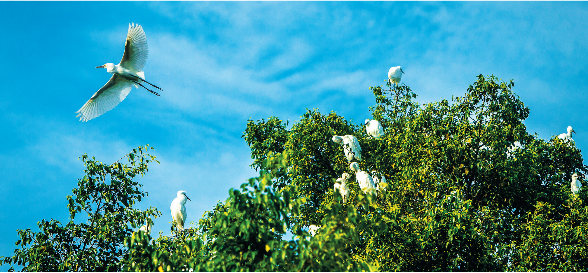
白鹭成群 诗意栖居

调查中发现的一个比较有趣的现象是，有不少海南冬季候鸟的种类也在夏季出现，包括黑翅长脚鹬、中杓鹬、红脚鹬等，它们是否会在海南繁殖还有待深入的观察和研究。据了解，此次调查由全球环境基金支持的海南观鸟会等单位组织开展。