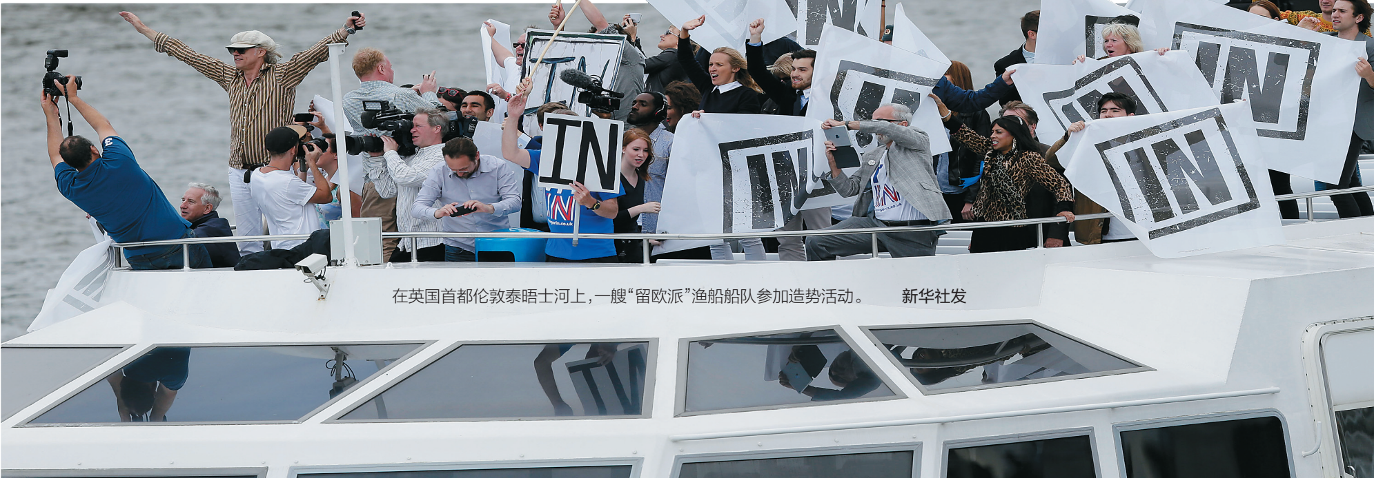
在英国首都伦敦泰晤士河上,一艘“留欧派”渔船队参加造势活动。

卡梅伦说,无论是工党还是保守党,都相信英国留在欧盟比离开更好。留在欧盟对英国来说更加安全,并能与欧盟其他国家建立更强大的合作。