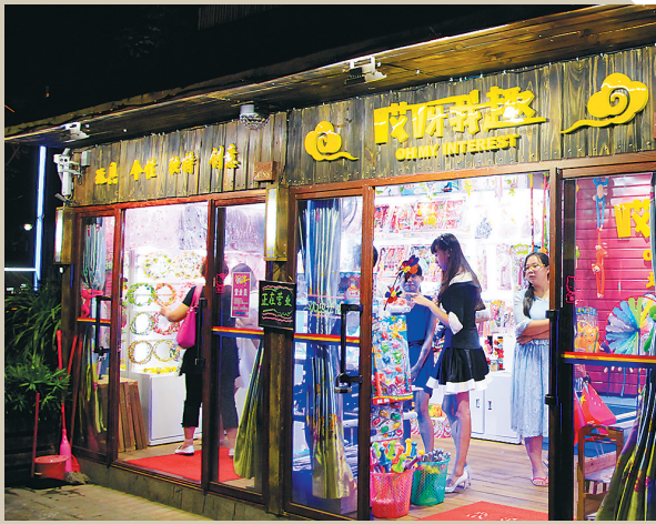
海口万绿园民俗风情街。