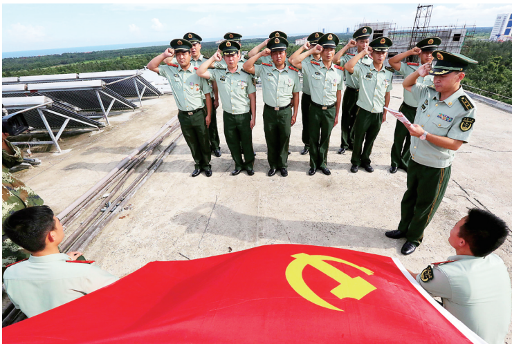
6月25日，文昌市龙楼镇，在火箭首飞来临之际，海南消防总队官兵在党旗前重温入党誓词。