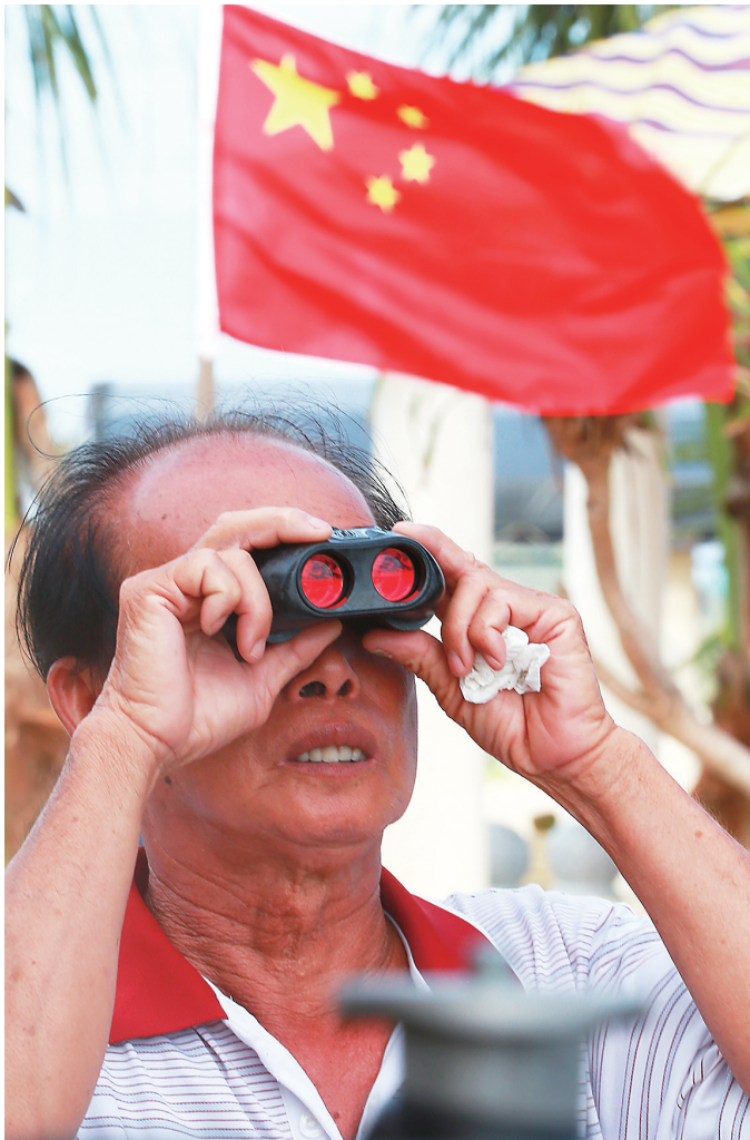
6月25日，当地群众手持望远镜观看火箭发射。