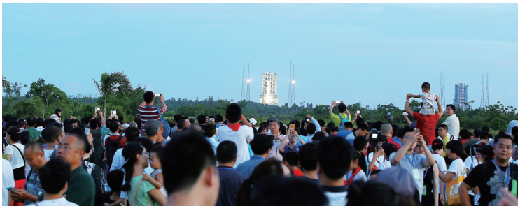
6月25日，游客等待长征七号发射。