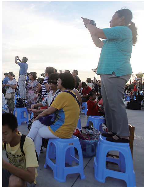
6月25日，游客用手机记录下文昌航天发射中心的美景。