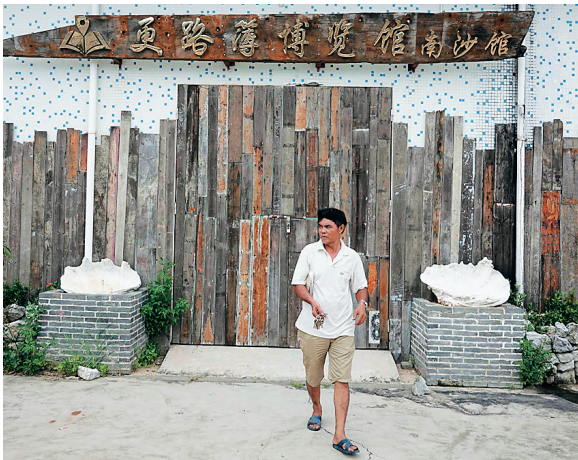
潭门镇民间自建的“更路簿博览馆”。