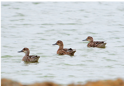
白眉鸭。 卢刚 摄

3天的调查结束后，海南观鸟会已着手整理出相关的数据和资料。这个夏天，海南多了一则关于一群水鸟和一群“鸟人”的故事：他们利用周末时间，白天扛着观鸟设备，追水鸟的踪迹，晚上录数据做登记，无任何报酬、纯义务地一起完成全省夏季水鸟调查。 “对我来说，顶着烈日跋涉到荒野观鸟得到的乐趣远胜于在公园的树荫下坐等鸟儿上花枝。这些正不断消失的生境让你对眼前这些可爱的生灵倍感珍惜，由此而生的对自然的敬畏，让你自觉做到‘来，只留下脚印；走，只带走记忆’。”海南观鸟会的一名“鸟人”蔡挺说，观鸟、做水鸟调查，他收获的不仅仅是鸟…… 对这群“鸟人”而言，这不是工作或任务，而是一份非做不可的热爱。毕竟，看或不看，鸟儿就在这里。☞