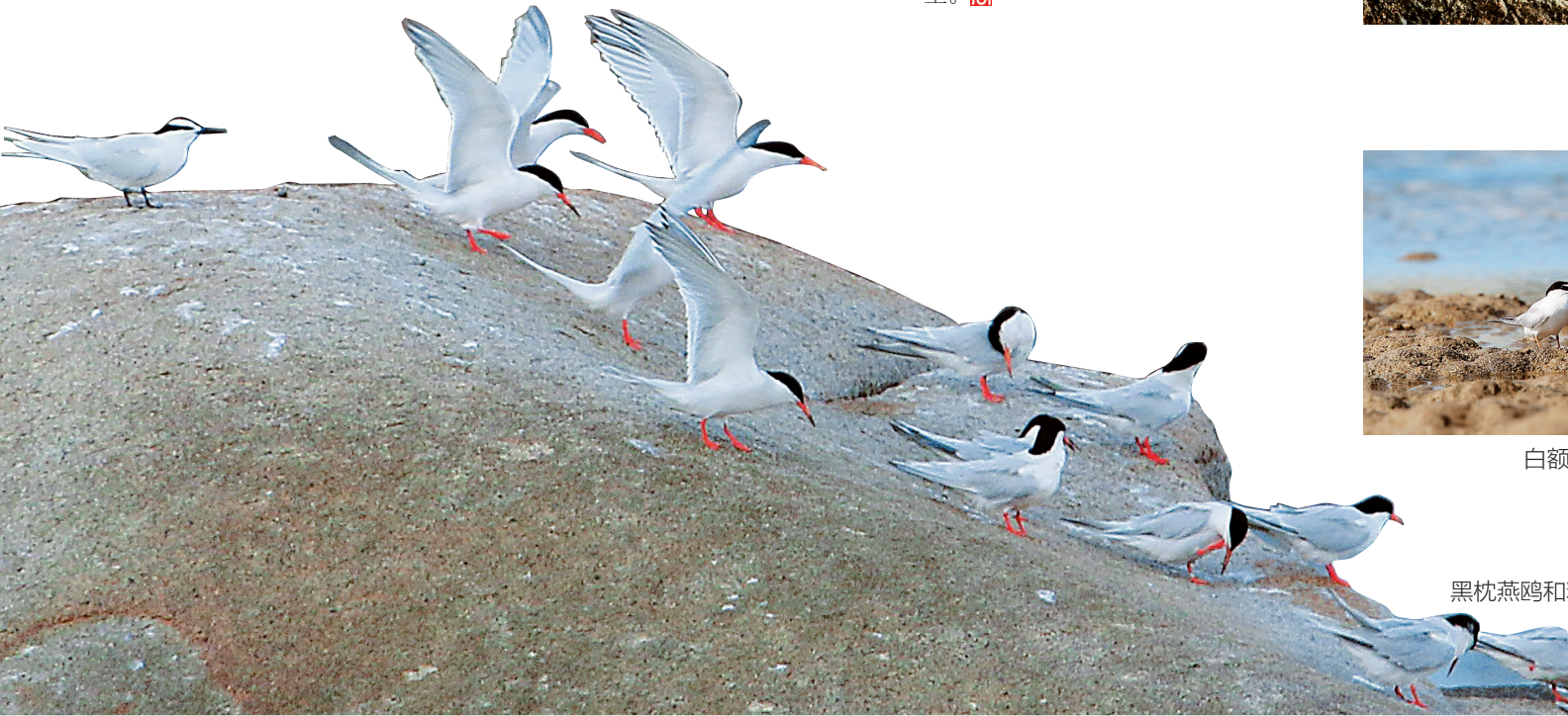
黑枕燕鸥和粉红燕鸥。