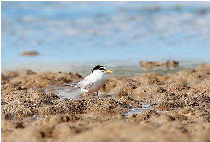
白额燕鸥。