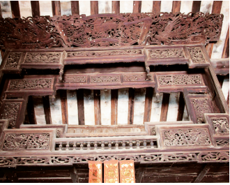
吉大文故居精美的神龛。

崖州举人吉大文(1828—1897)以诗名行世,官声也不错,他的生活轶事,也充满着诗意,在崖州大地口口相传。作为当时崖州读书人科举成名的崇拜偶像,吉大文的名字,可以说无人不知晓。崖州即今三亚、乐东一带,是古代海南文化的南部重镇。吉大文即出生于土地肥沃的崖州之西,浩瀚南海之滨的镜湖村(今乐东九所镇镜湖村)。镜湖村紧傍镜湖之东岸,山清水美,风光旖旎。有语云:“钟灵毓秀”,“山水出名人”。