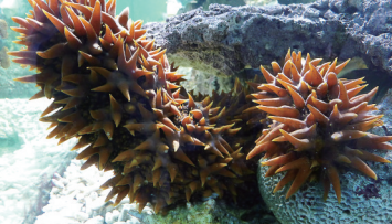
渔民抓获的梅花参。