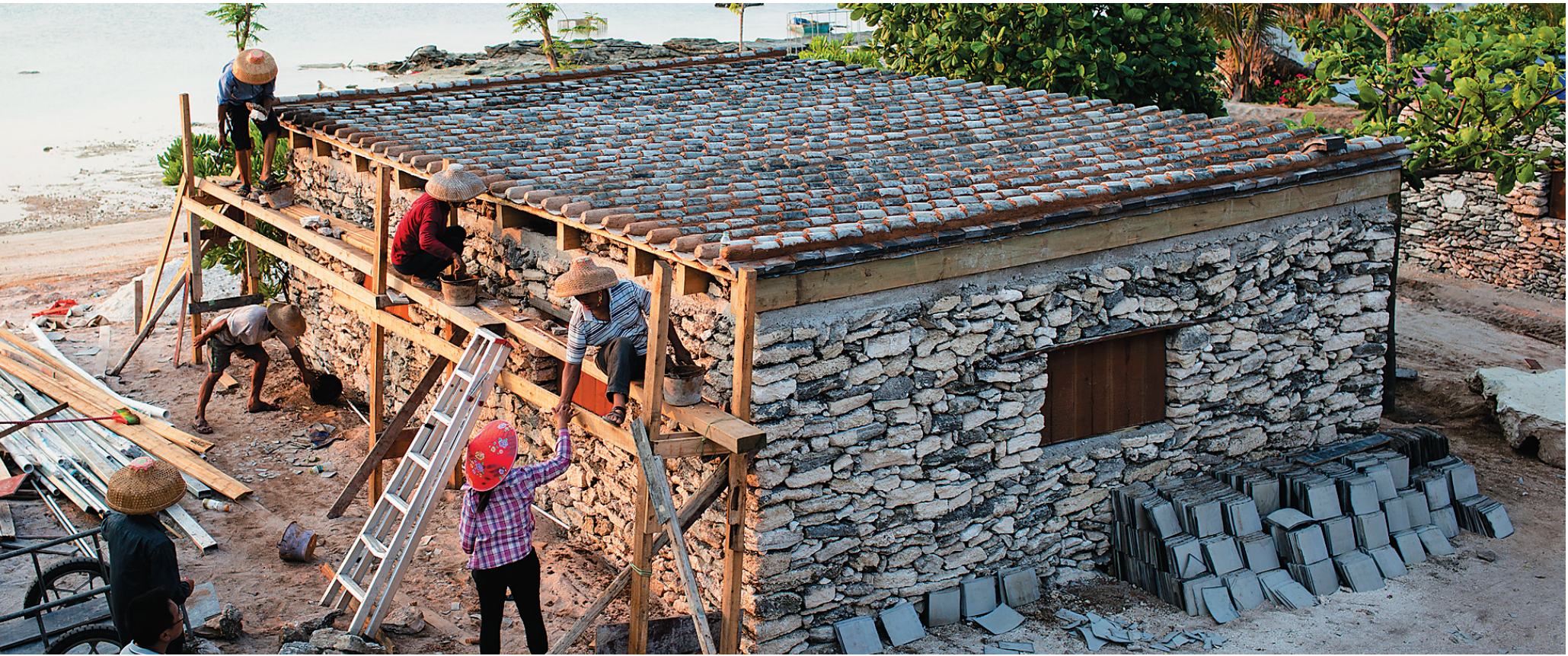
三沙：修复承载历史的珊瑚石屋

三沙市七连屿工委成立后，岛上居民的定居房开建，岛上两间已有近二十年历史的珊瑚石屋面临拆迁。经过考虑，工委决定保留并修复这两间承载老一辈人守护祖宗海历史、并具有见证意义的珊瑚石屋。目前，这两间珊瑚石屋已完成主体改造。