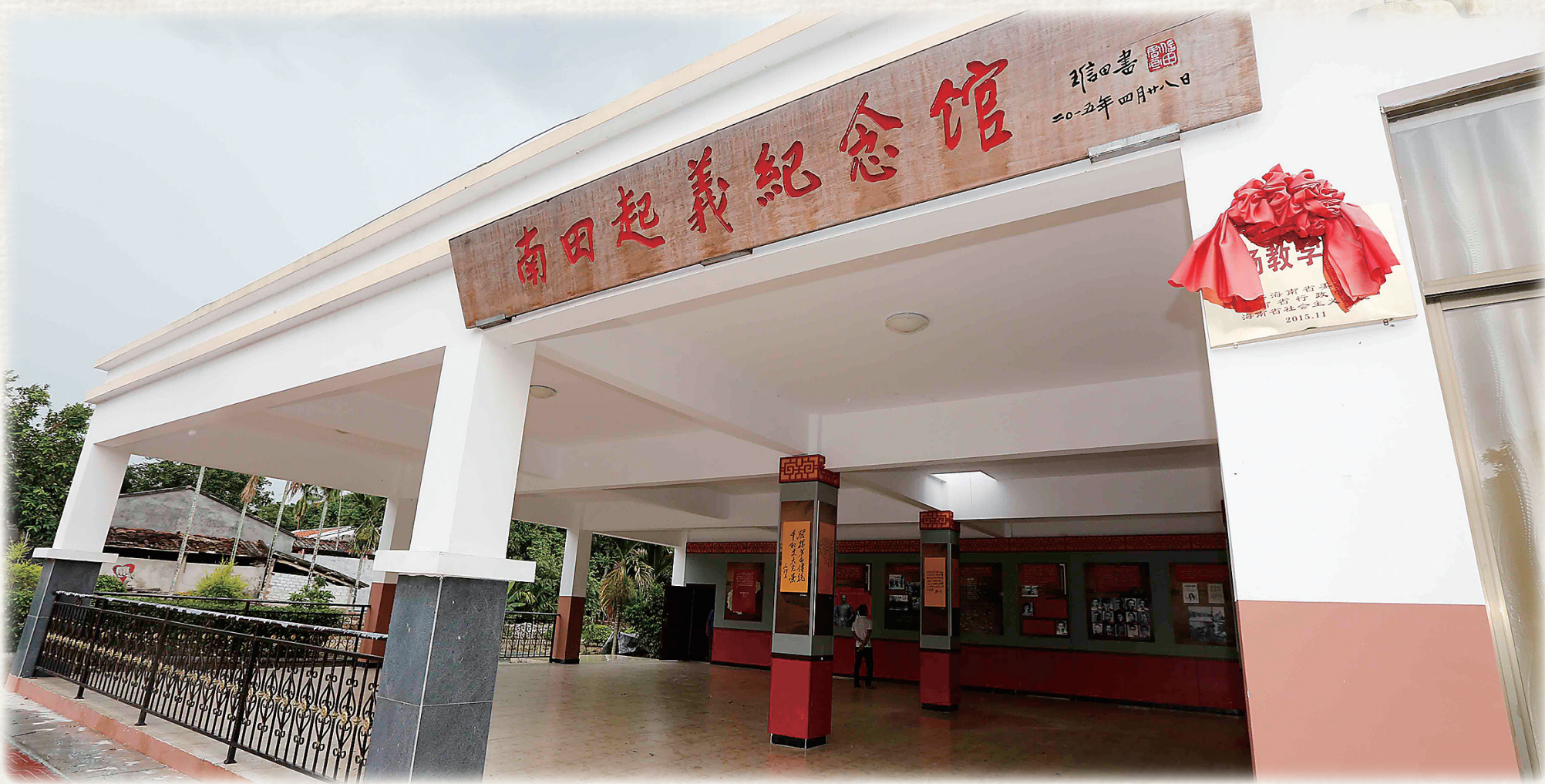
屯昌县西昌镇南田村，南田起义纪念馆。一九二七年十二月初，黄瑞三率农民自卫队协助工农革命军进行了南田起义，极大地打击了敌人的嚣张气焰。