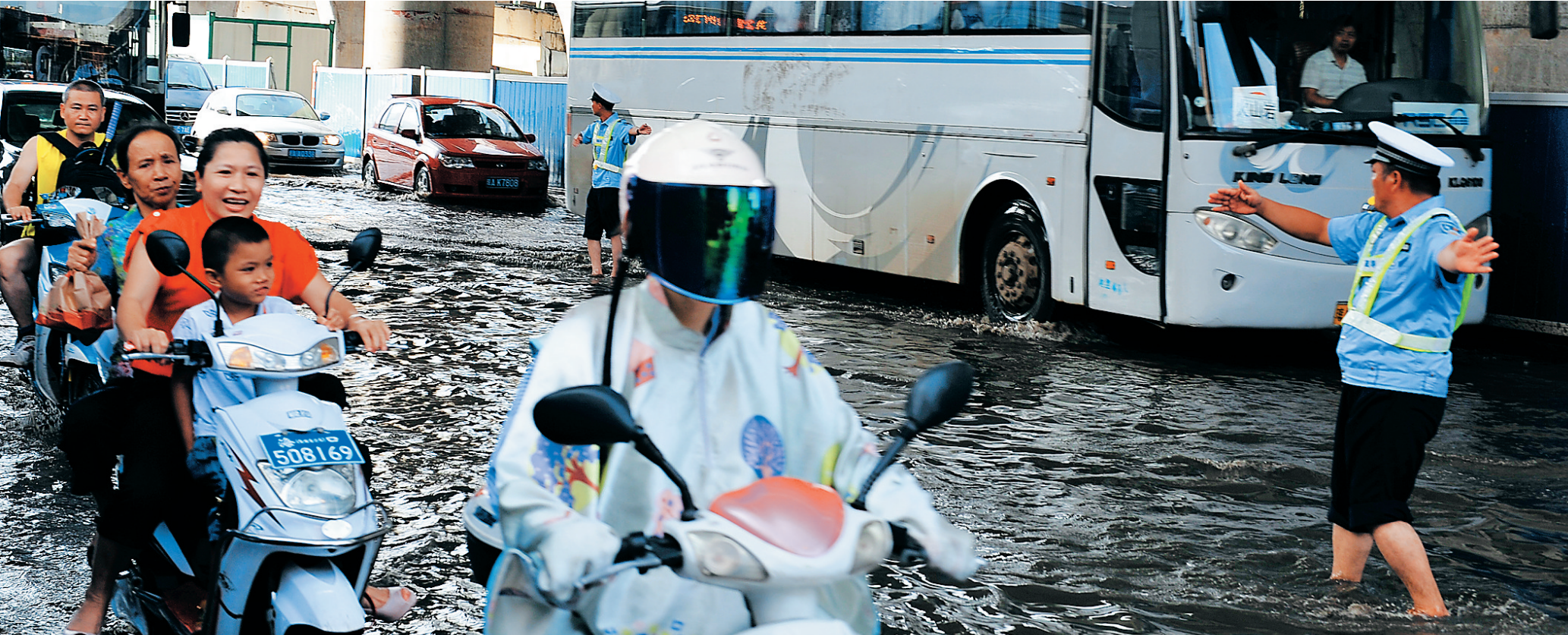
水中交警温暖市民回家路 28日下午5时左右,一场大暴雨让海口市龙昆南路南大桥下积水严重,桥下的施工路段坑洼不平,汽车尤其是电动车极有可能误入水坑造成险情。两名交警脱掉鞋子、卷起裤脚,站在水坑中,指挥过往车辆安全通行。