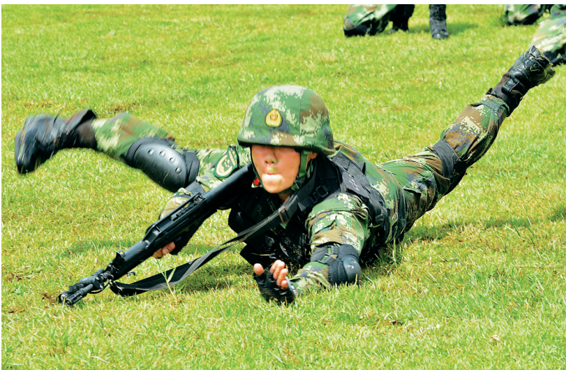
演练中的武警战士。