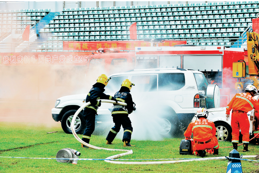
消防大队对交通火灾实施扑灭。