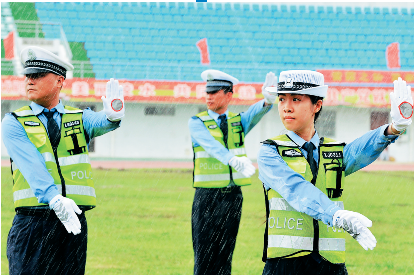
陵水交警大队民警进行交通指挥手势表演。