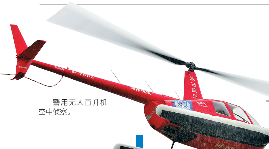
警用无人直升机空中侦察。

暴恐袭击事件处置、交通事故灭火抢险、群体性事件处置、盾牌警棍术、搏击术、警用直升机空中盘旋指挥、警用无人机空中侦察……6月29日，在建党95周年来临之际，陵水黎族自治县公安局维稳处突实战演练，利剑出鞘，500名警力在陵水县海航体育场精彩亮相，投入维稳处突实战汇报演练，全面检验陵水警方应急反应能力和联合作战能力，以更好地应对新常态下对维稳处突工作提出的新要求、新挑战，向广大人民报告，向建党95周年献礼。