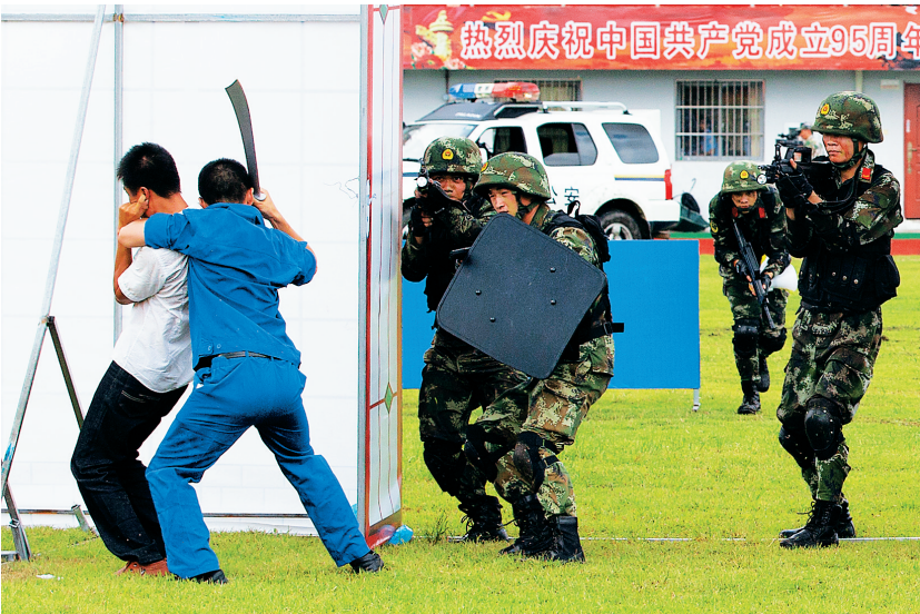
处置劫持人质事件科目，武警战士在解救“人质”。