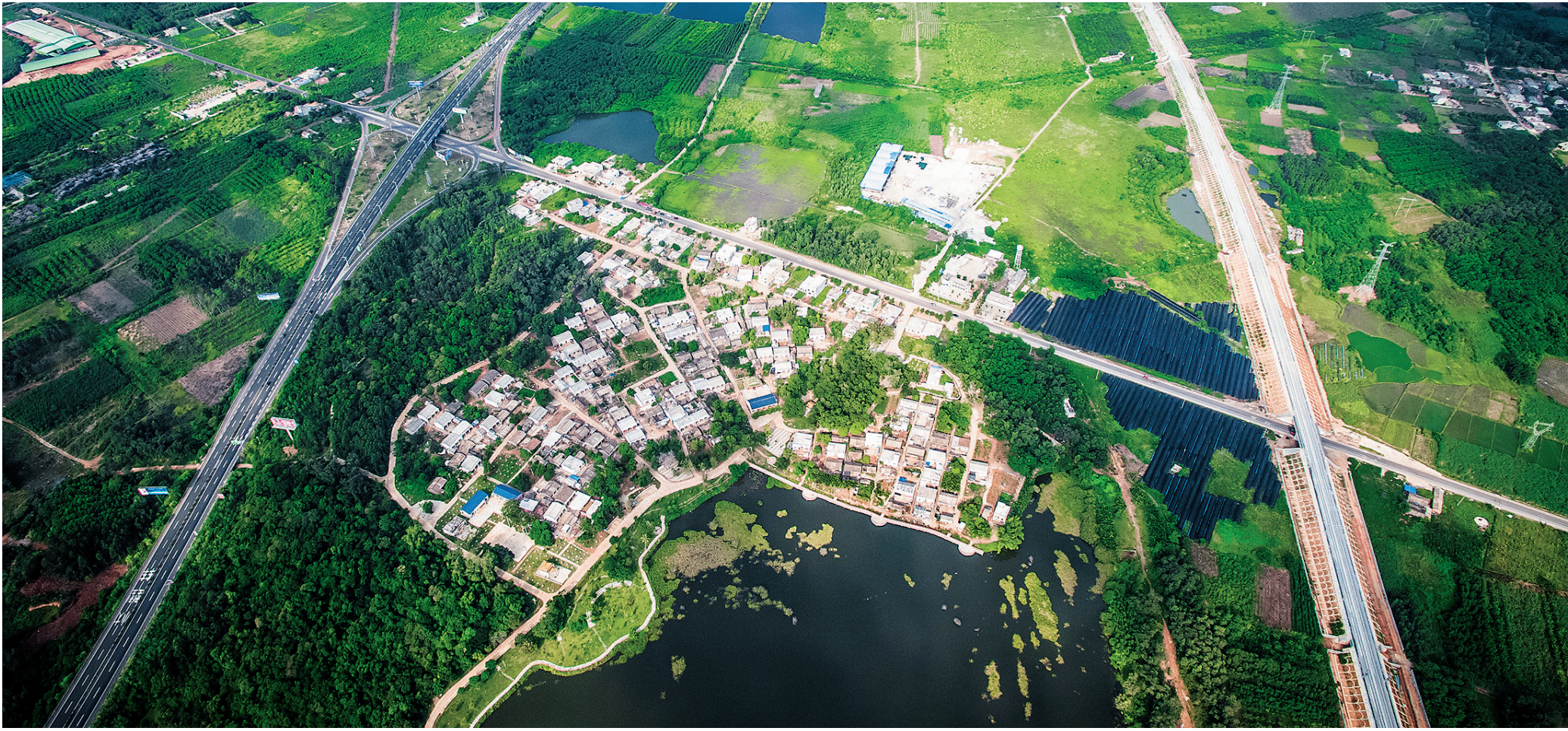
西环高铁经过临高博厚镇美伴村。