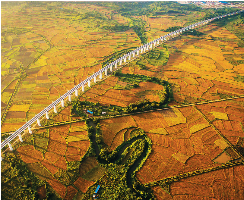
西环高铁经过贡米之乡——澄迈县老城镇龙吉村。

车的同时，坐上旅游小火车。 “有了高铁，一切都变得更快捷了。”澄迈县交通运输局局长王远锡说，根据规划，澄迈县将要打造“一都两中心三区四镇”经济发展战略，澄迈县金江镇将朝着“休闲娱乐之都”的方向发展，同时借助西环高铁的建成，澄迈县的物流业和旅游业也将得到带动，“两中心”正是指位于金江镇金马大道的“金马物流中心”，以及“粤海铁路南站物流中心”。“三区”则是指位于盈滨半岛的国家4A级度假旅游区，以及“加笼坪热带雨林旅游区”和“老城经济开发区”。 与此同时，澄迈境内的老城经济开发区、金马物流中心、琼台全面战略合作基地、福山咖啡文化风情小镇等4个园区，也将结合西环高铁建设进行调整规划，使产业布局、市政道路公交配套等与西环紧密对接。借助澄迈“世界长寿之乡”的美誉，澄迈的休闲旅游、高端地产以及康复康体养生等产业也得到顺势蓬勃发展。