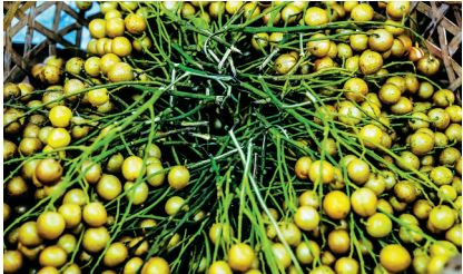
符树武家的黄皮挂满枝头。