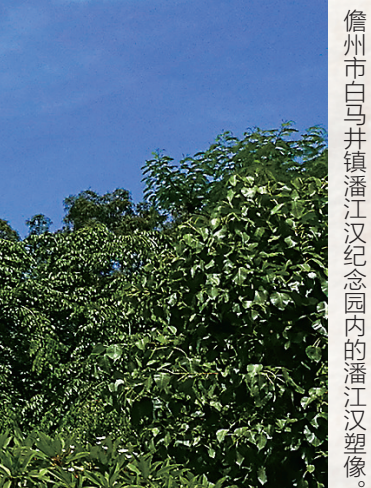
儋州市白马井镇潘江汉纪念馆内的潘江汉塑像。