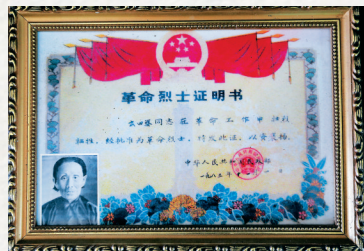
云四婆的革命烈士证书。