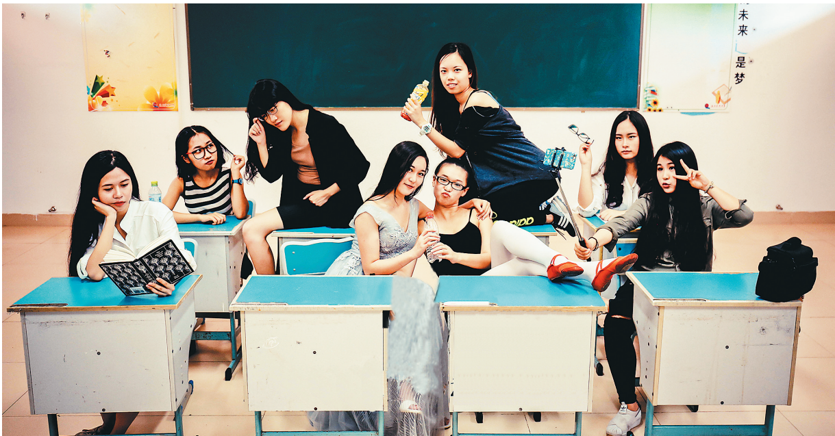
八位个性迥异的女孩完成了各自的蜕变。