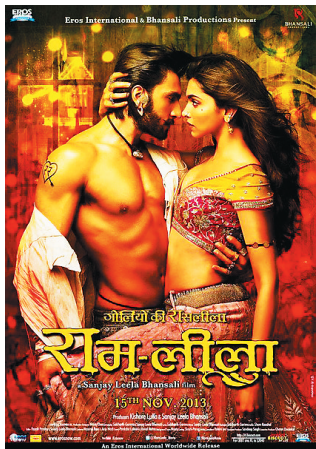
《弹雨里的爱情》：印度版罗密欧与朱丽叶。

中国的传统曲艺评书里，在一个人物出场时，经常会有一大段的韵律鲜明朗朗上口的“赞儿”，例如三国评书里用于表现吕布的“赞儿”：头戴三叉束发紫金冠，雉鸡翎，微微颤，少年英俊芙蓉面；红战袍，川锦缎，上绣百花真鲜艳；亮银铠，龙鳞片，吞口兽面挂连环；狮蛮