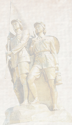
白沙起义烈士纪念碑。