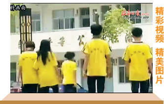
精彩视频 精美图片