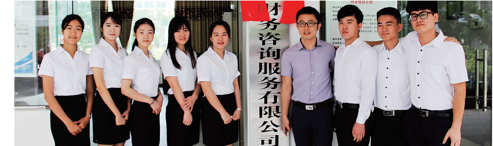
在校学生众筹成立财务咨询服务公司。

为了帮助毕业生增强就业竞争力，学院每年10、11月份都会举办“就业服务月”活动，开展相关就业创业政