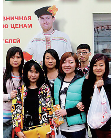
2012年9月，学院第一批俄语专业学生赴俄留学。