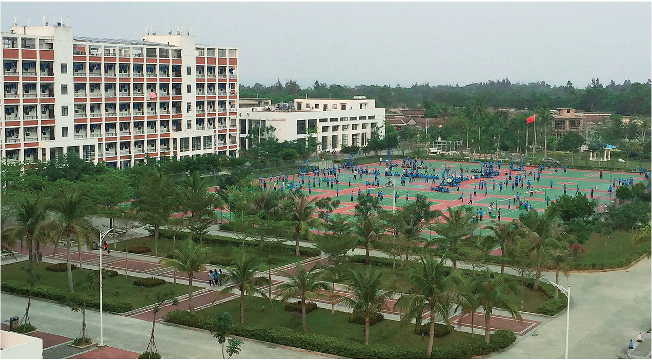
短短四年，北京师范大学万宁附属中学交出了一份含金量足的办学成绩。