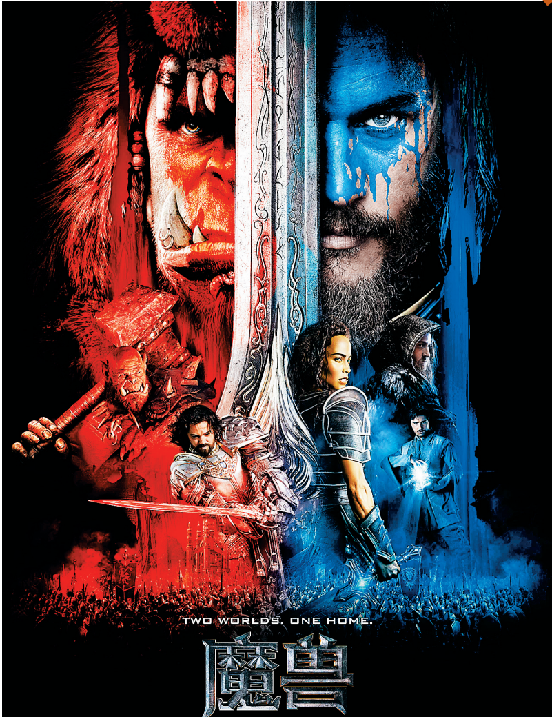
《魔兽》为6月票房回暖贡献了力量

记者获得的数据显示，到今年上半年结束之时，全国各大院线的银幕数量已经达到3.3万张，比去年年底时的近3万张多出了整整3000张。 然而，银幕数量虽然多了，票房收入却并未成正比增多。今年以来，全国单银幕产出只有750元左右，远低于去年同期的810元。 业内人士解释，并不是电影院线建设过多或者银幕数量增加过快，主要原因还是由于没有与这么多影院相适应的大片、热片上映，导致观众在工作日期间甚少进入影院观影。 “去年底，面对全国票房超过440亿元的大好形势，就有人预测今年全国票房将达到600亿元。现在看来，2016年全年票房600亿的目标还比较遥远，也可以说成是任重道远吧。”海南院线业内人士说。 记者从数据上分析，今年上半年全国票房报收247亿元，比去年同期的203.63亿元只增长了21.2%，虽然仍然保持着增长，但这个数字比起2015年上半年较2014年增长的50.3%的增幅，显然，增长态势平缓了很多。目前，全国半年票房大盘距600亿元的票房目标还差353亿元，想要实现600亿元这个大目标，真的仍需业内人士共同努力。 （本报海口7月5日讯）