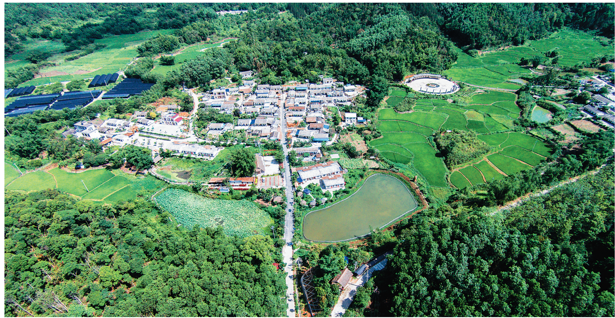
什寒风光。