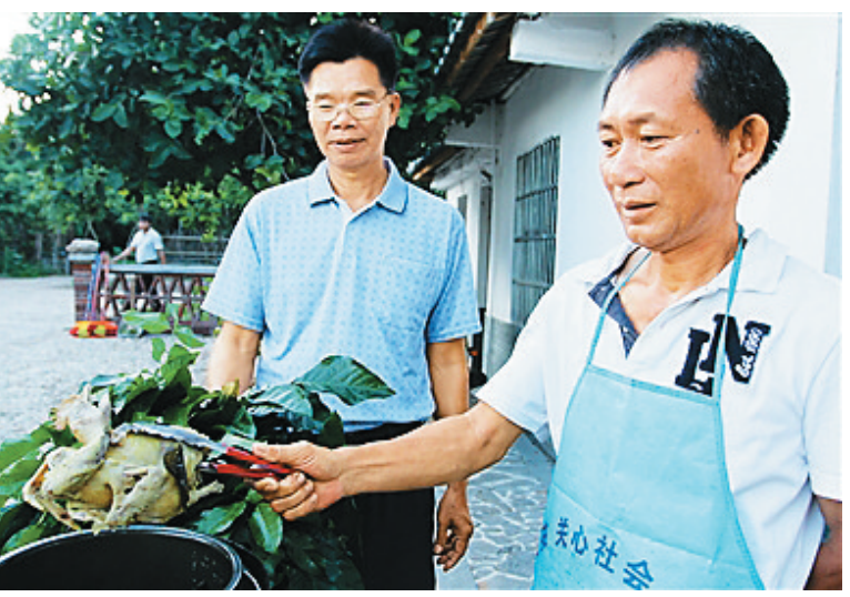
儋州黄皮鸡。(资料图片)

在什寒,村民是乡村旅游永恒的主角。人在,民俗在,乡愁在,这才构成了人们心中的“中国最美乡村”。