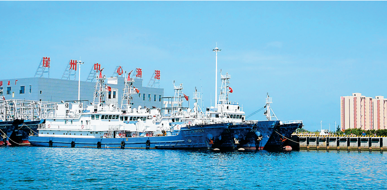
三亚崖州中心渔港。目前，渔港一期建设的码头主体工程、港池航道、交易中心、冷库等开港必需工程已经顺利竣工。

“2015年三亚坚持‘严查存量、严禁增量’的原则，始终保持打违高压态势，严厉打击违法乱搭乱建、抢建抢种，集中力量打击违建重灾区村庄和重点项目用地内的违法建筑，大力查处非法买卖土地、建设和出售小产权房的行为。全年拆除违建388.57万平方米，今年还将拆违300万平方米。”三亚市综合执法局有关负责人说。