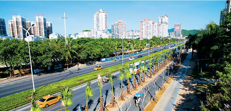
三亚凤凰路改造后，隔离带、绿化带种植糖棕、蒲葵和雨树，三种热带树木形成的不同遮阴效果，增加了道路的观赏性和实用性。