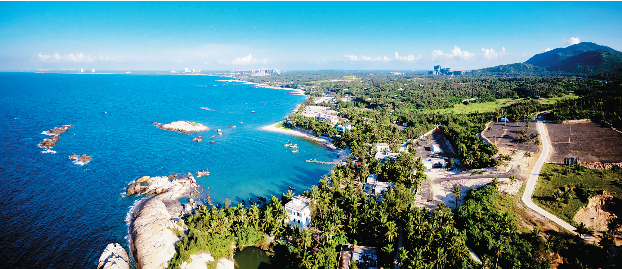
文昌龙楼镇石头公园，旅客在这里可观看火箭发射，还可以欣赏奇石景观。