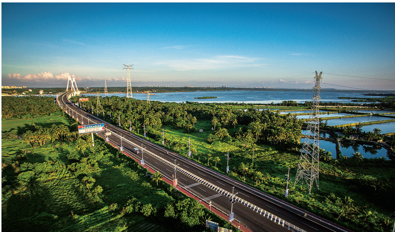
文昌通往龙楼的滨海旅游公路两边热带风光迷人。