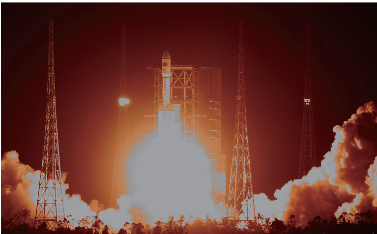
6月25日，长征七号运载火箭在文昌航天发射场成功发射。