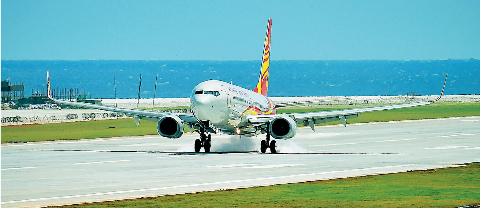
7月13日,海南航空公司的客机在渚碧礁新建机场着陆。

新华社海口7月13日电 (记者刘奕湛 赵颖全)13日8时30分、8时40分,中国政府征用的南方航空公司、海南航空公司两架民航客机先后从海口美兰国际机场起飞,经过近2个小时的飞行,分别于10时29分、10时28分在美济礁新建机场和渚碧礁新建机场平稳着陆并于当日下午返回海口,试飞成功。