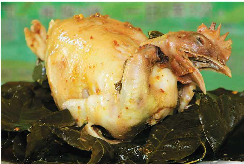
儋州黄皮鸡历史悠久。