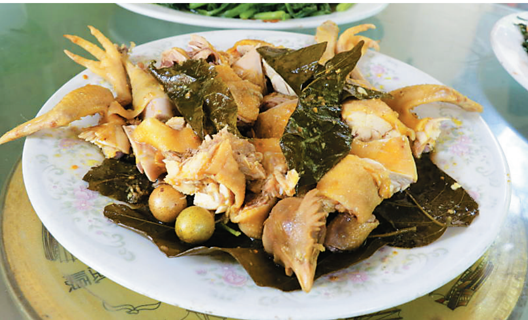
黄皮鸡肥而不腻,十分鲜美。

黄皮鸡是儋州的传统美食,以前虽也有名,但只局限在儋州境内。随着儋州黄皮品牌效应不断扩大,儋州的黄皮鸡也随之声名鹊起,受到越来越多的食客追捧。