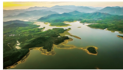
石碌水库