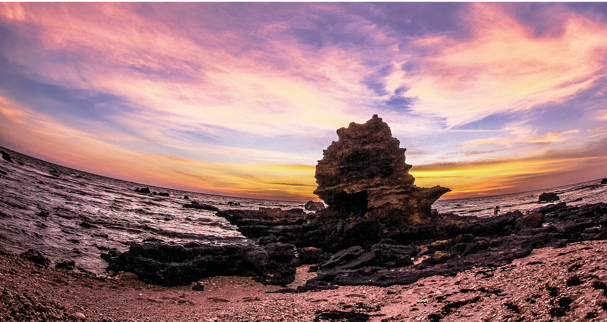
儋州峨蔓镇龙门激浪。