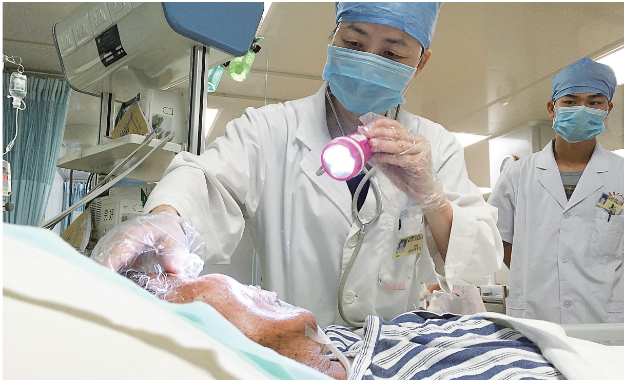
容美桑和医护人员每天都在与死神进行拉锯战。