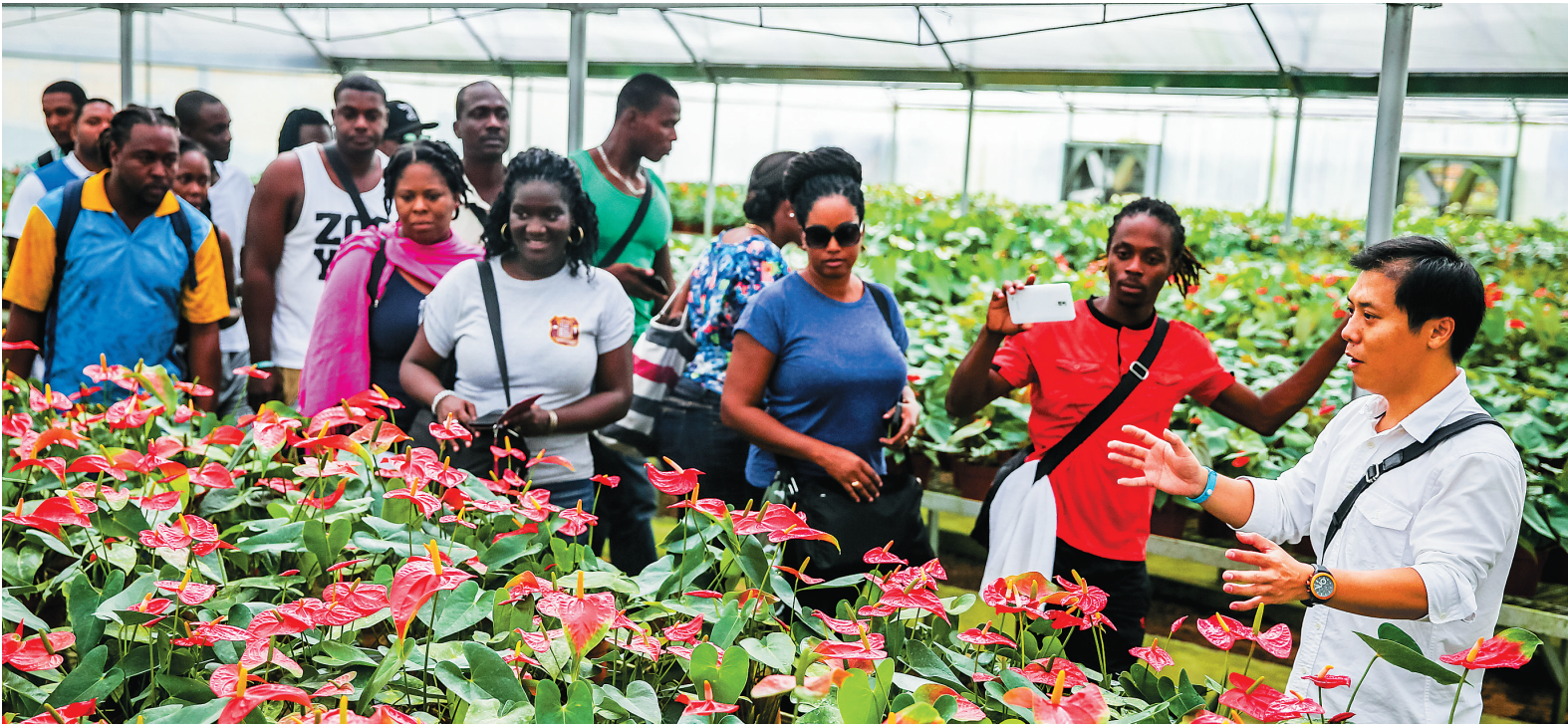
外国学员“拜师”热科院专家

设厅统计截至本月末各市县商品住宅库存消化期。对商品住宅库存消化期高于全省平均水平的市县,在下一半年实施“两个暂停”。未列入“两个暂停”的市县,实行商品住宅用地计划管理,商品住宅用地计划周期为半年。农垦系统商品住宅用地计划指标实行单列,不占用所在市县指标,按照不超过全省商品住宅用地计划指标总额的10%予以核定并下达。各市县不得超商品住宅用地计划指标办理商品住宅项目、产权式酒店项目用地供应以及改变土地用途用于商品住宅项目、产权式酒店项目用地审批。