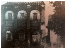
定安县农民运动训练所旧址。