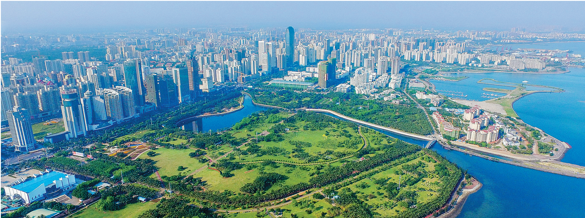
「双创」让滨海城市海口焕发新生机，充满新活力。