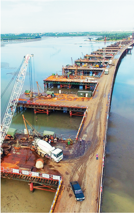
全省上半年固定资产投资完成1583.14亿元，同比增长9.1%。图为正在建设的文昌铺前大桥。