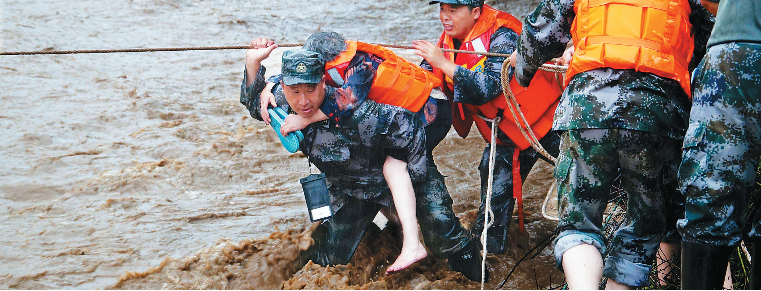
七月十九日，湖北省恩施市突遭暴雨袭击，崔家坝镇斑竹园村因山洪暴发，村旁的河道成了湍急的河流，二十多名群众被困家中。图为民兵应急队员在转移被洪水围困的村民。

新华社银川7月20日电 正在宁夏考察的中共中央总书记、国家主席、中央军委主席习近平在东西部扶贫协作座谈会上专门就做好当前防汛抗洪抢险救灾工作发表重要讲话，强调当前防汛抗洪抢险救灾形势非常严峻、任务非常繁重，各有关地区、部门和单位要把确保人民群众生命安全放在首位，进一步行动起来，强化措施，落实责任，全力做好防汛抗洪抢险救灾工作。 习近平指出，受超强厄尔尼诺现象影响，今年我国气候十分异常，我国入汛提前。入汛以来，南方发生20多次强降雨过程，太湖发生流域性特大洪水，长江中下游干流全线超警，部分地区洪涝灾害严重。党中央高度重视防汛抗洪抢险救灾工作，强调要立足防大汛、抗大洪、抢大险，做好抗击特大洪水