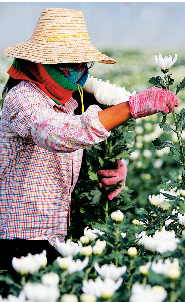
东方今年将重点打造东方黄花岗、菊花等“十大农业知名品牌”。图为花农在采收白菊花。