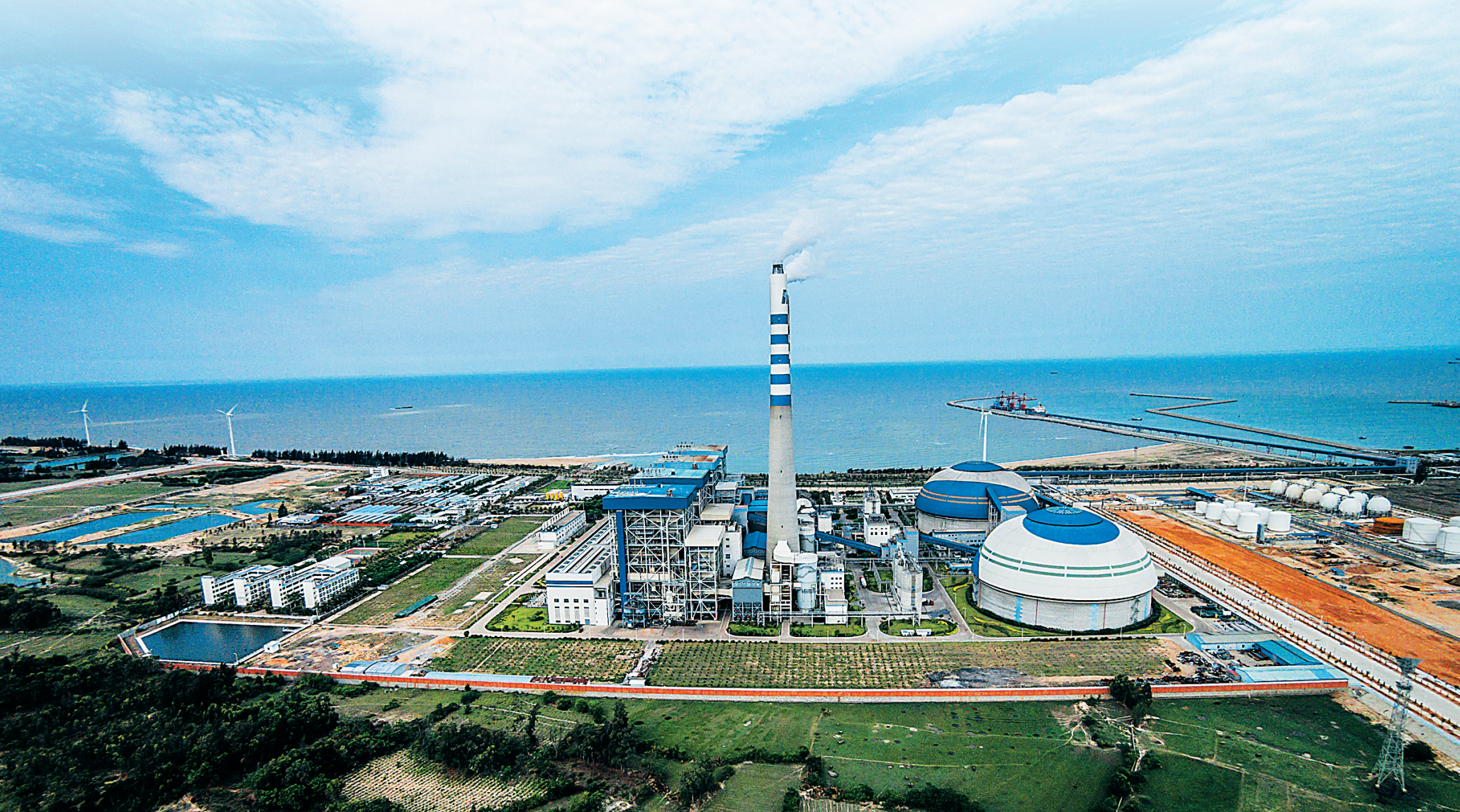
工业是东方的支柱产业之一。图为东方工业园区一角。