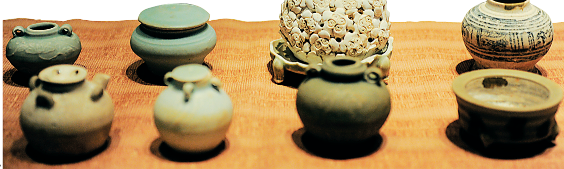
各式各样海捞瓷,大部分从渔民手中淘来。

7月24日是三沙设市四周年的日子。在浩瀚的南中国海上,千百年来,早就留下中国人耕海牧渔和远航贸易的轨迹,那些从水下发掘或捞起的沉船瓷器,更是对中国人悠久南海历史的有力见证。 今天,人们将从海底捞上来的宝贝统称为“海捞”,除了海捞瓷,还包括海捞钱币、象牙、香料、石雕、琉璃、铜镜、红木、兵器、珊瑚、紫砂、茶碾等。 在收藏者的心目中,“海捞”不但具有文物历史价值,还是反映中国人通过南海这条海上丝绸之路,走向世界各地的重要证据。