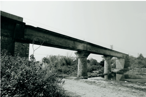
1940年,日军建的铁路桥。