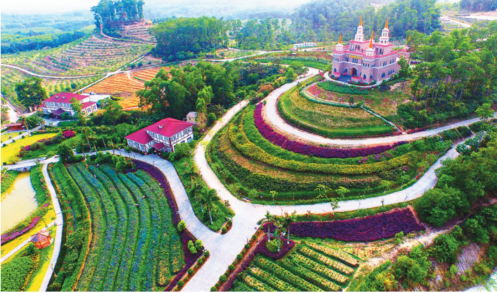
屯昌县梦幻香山芳香文化园景区是度假放松好去处。