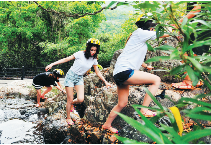
呀诺达雨林文化旅游景区吸引游客避暑度假。