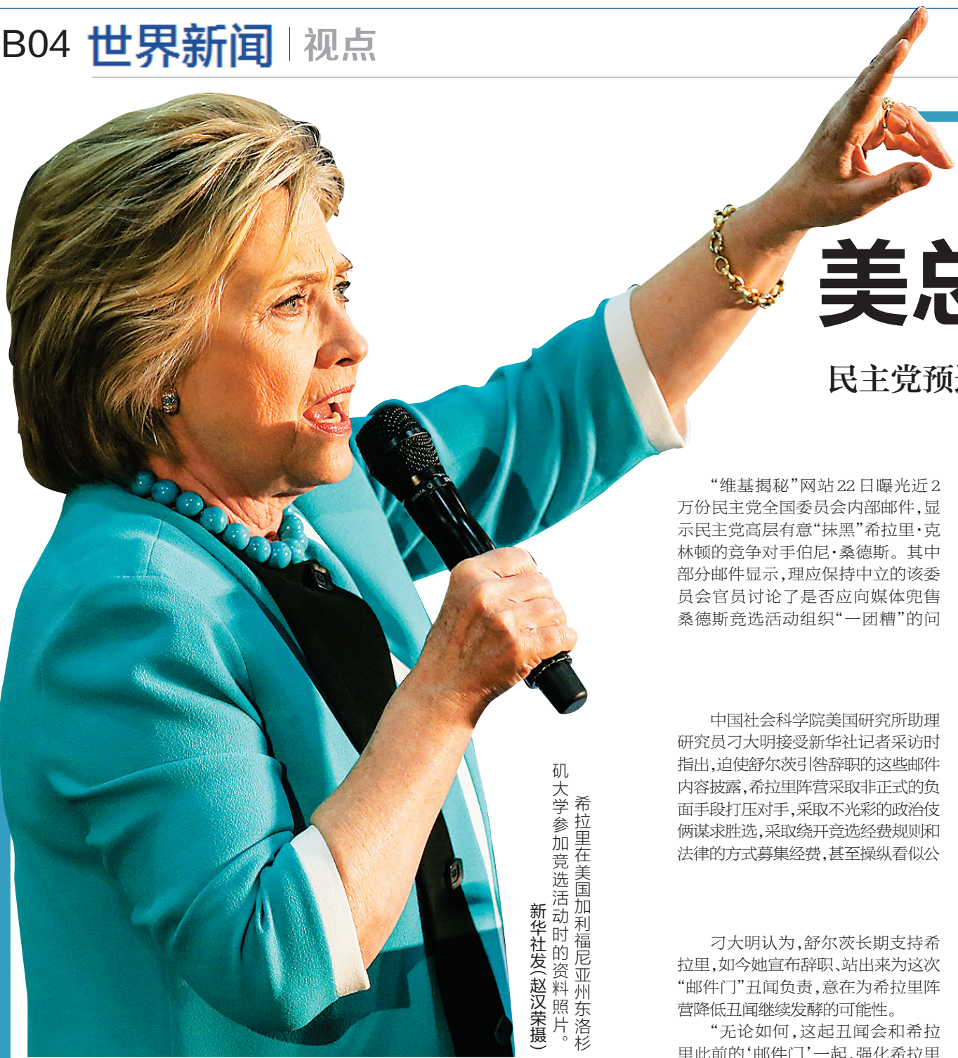
希拉里在美国加利福尼亚州洛杉矶大学参加竞选活动时的照片。

“维基揭秘”网站22日曝光的近2万封民主党全国委员会官员在党内预选阶段的邮件通信记录显示，应严守中立立场的民主党全国委员会涉嫌破坏党内总统竞选人桑德斯的预选活动