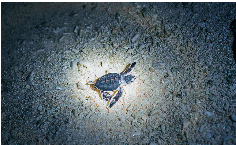
↑7月25日19时36分,在三沙市北岛,一只刚出壳的小海龟爬向大海。

记录。19时多,在距离大海龟产卵的100多米外,巡护人员在此前记录的一处海龟产卵点发现有沙土下陷的情况。依据经验,巡护人员判断很可能有小海龟要破壳出生了。很快,记录点位置开始出现动静,一只只黑褐色的小绿海龟先后从沙里爬出,并