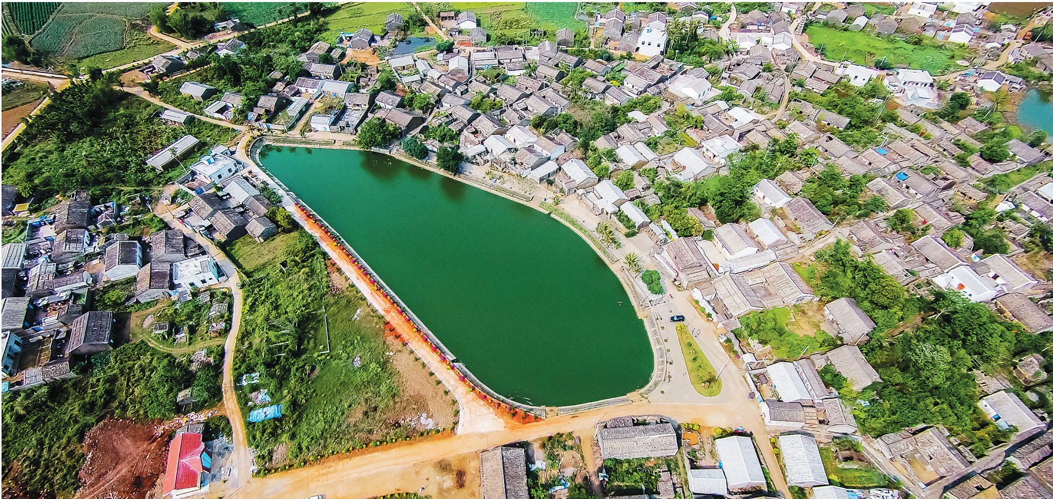
澄迈县罗驿村。