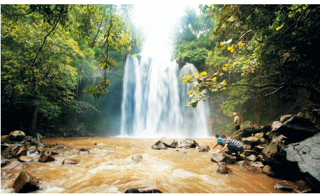
本报记者 袁琛 摄

推荐理由: 位于临高县新盈镇与儋州交界处的彩桥红树林,是一片尚未开放的自然生态保护区,风景如画。附近新开的一家农家乐,汇聚了临高文化的诸多要素,游客不仅能欣赏到秀丽的景色,品尝到菜团子、大锅菜、贴饼子、炖柴鸡等地道的农家饭,还能体验到垂钓、采摘、游览等乡间休闲活动,品味临高风土人情。