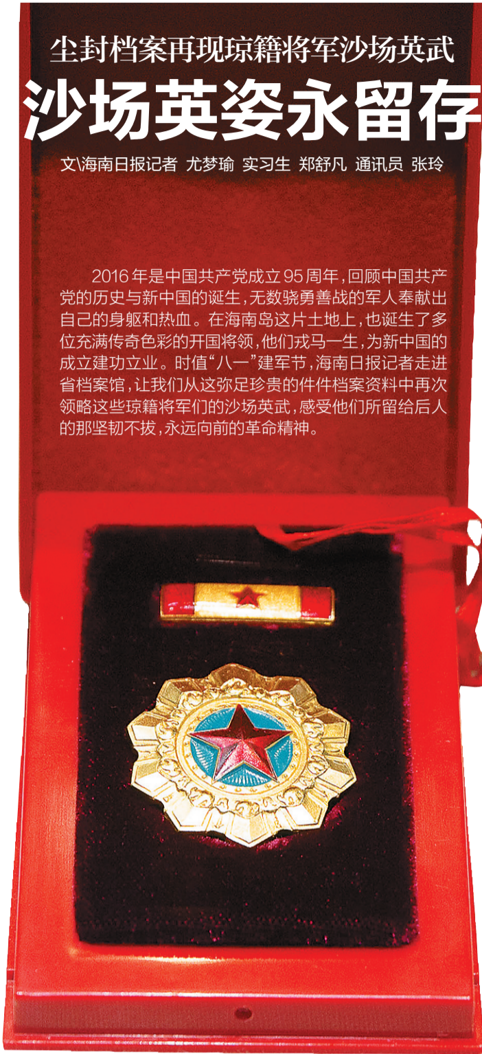
开国中将卢胜的勋章。