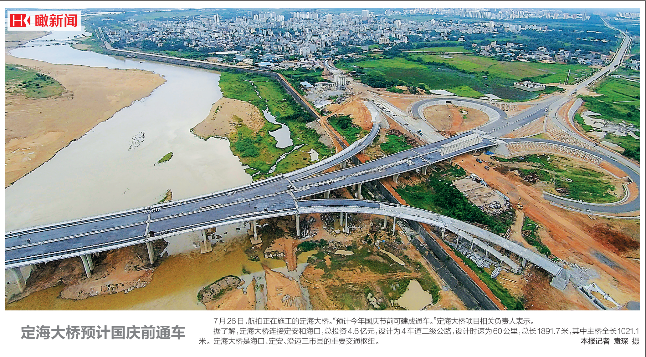
定海大桥预计国庆前通车

进行改造,投入资金2969万元。 两年来,通过土地整理项目的实施,配套完善了区内农田基础设施,农田有效灌溉率达到90%以上,基本实现了旱涝保收、稳产高产,田间道路和生产道路的修建也更便于耕作,提高了集约化程度和机械化水平,达到田成方、路成网、渠相通、旱能灌、涝能排的效果,大大提高了耕地质量。 据了解,自2011年以来,我省共投入37亿元进行土地整治,惠及39万群众。“十三五”期间,我省还将通过实施土地整治项目建成60万亩高标准农田,并加大补充耕地力度,通过土地整治新增耕地10万亩。 (本报金江8月3日电)